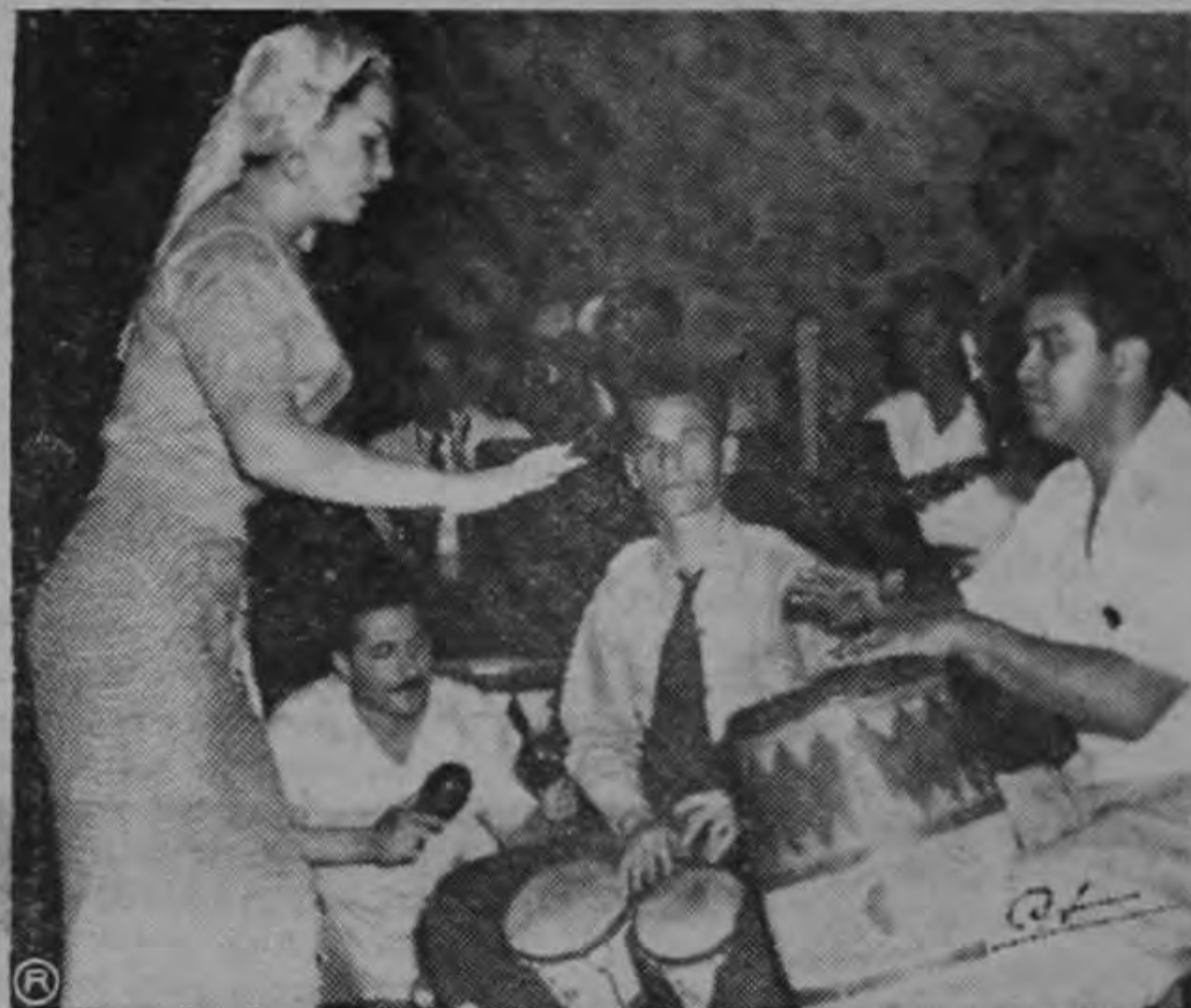
"TONGOLELE", danzando durante el ensayo realizado ayer en el Teatro Center City, ante los periodistas.

El empresario de espectáculo don Antonio Múculo nos invitó ayer a una exhibición privada y a partir por un corto rato con la artista Tongolele, quien debutó anoche en el Teatro Center City.